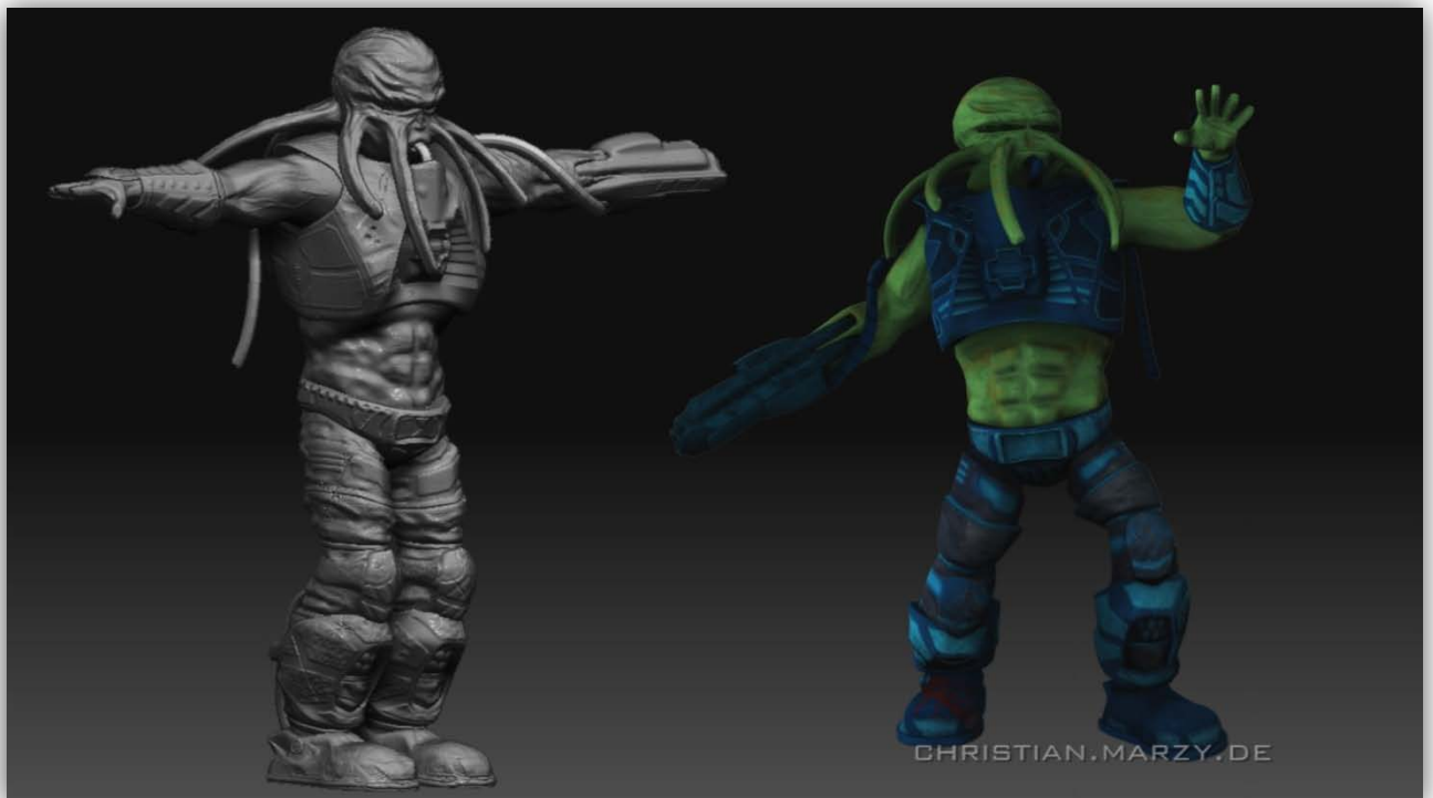
Game Character Model with Normal Map and Texture (XSI, ZBrush)