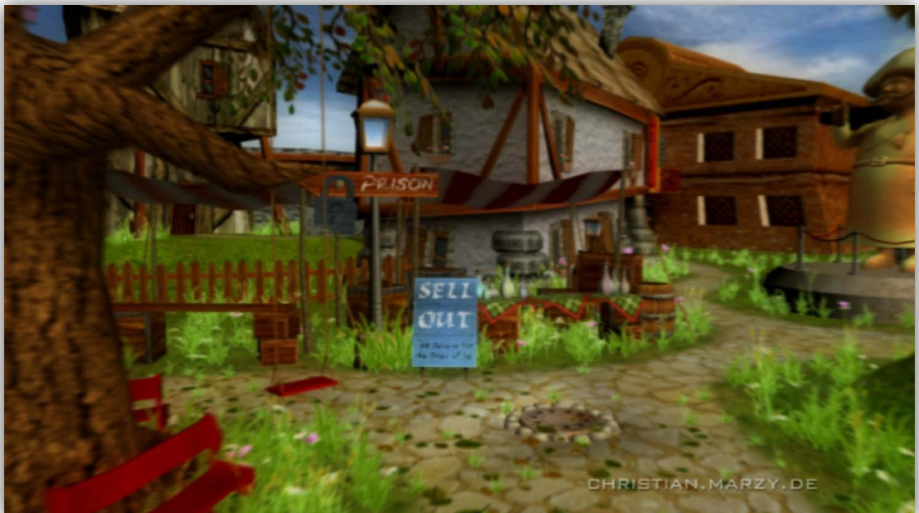
Game Environment, texturing only (3DS Max, Photoshop)