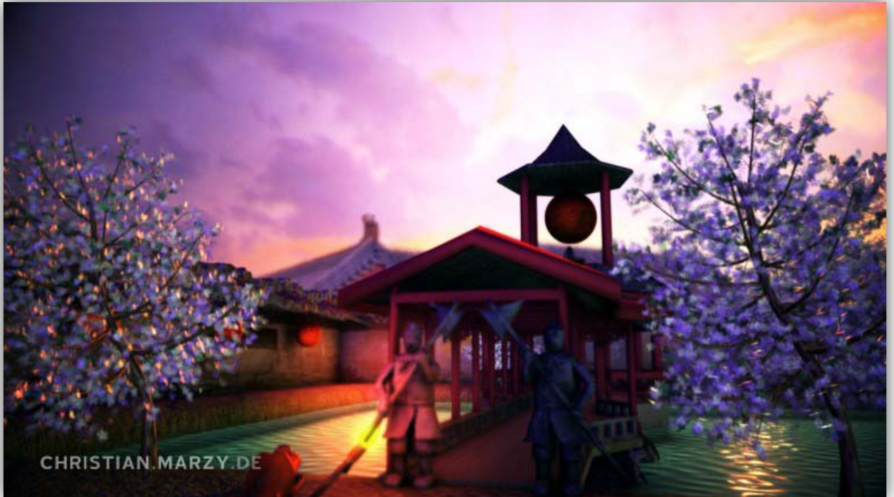
Soloprojekt: 3D-Animated Short "Valoo"