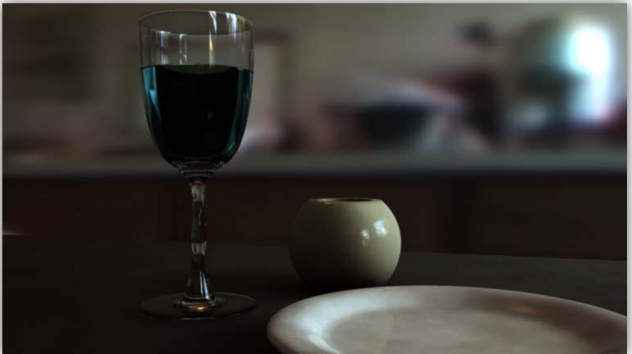
Shading in XSI